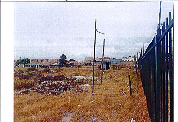
Vista interna M1: Cerramiento