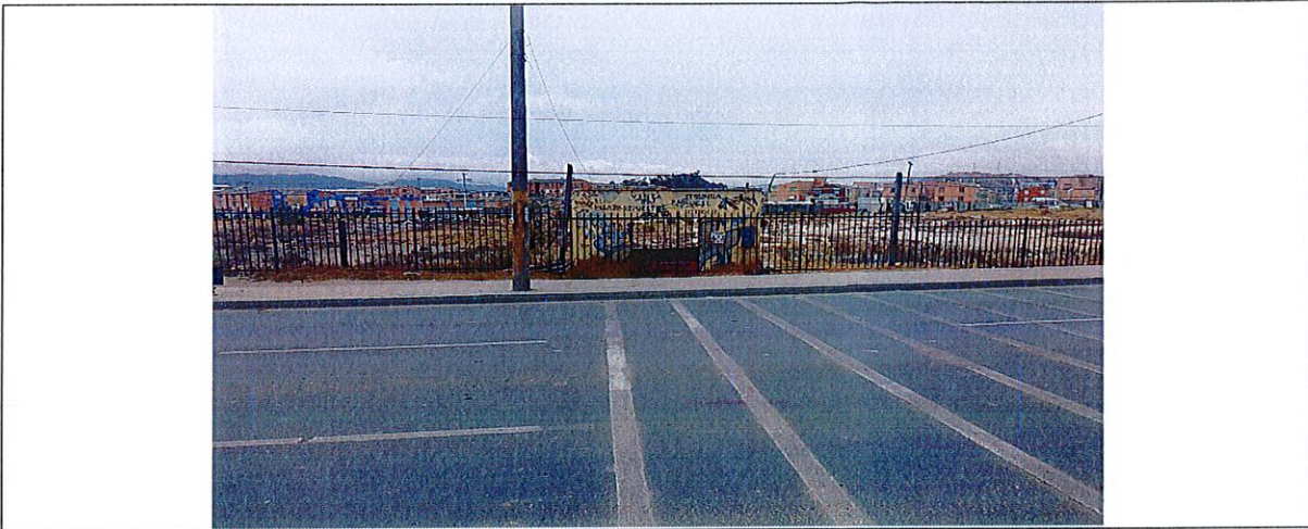
Fachada principal – Carrera 4 – Autopista Sur