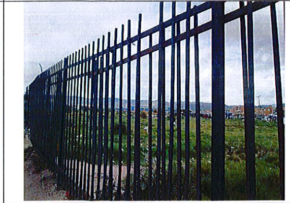
Vista interna M1: Cerramiento