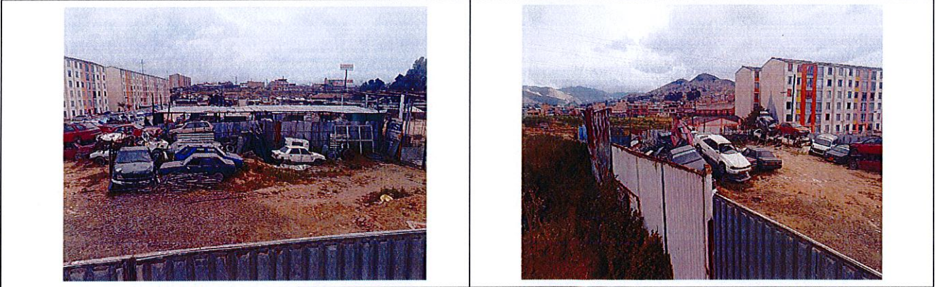
Vista general interna.