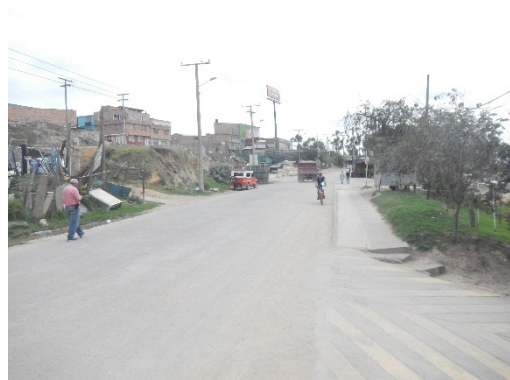
Vista general Calle 7.