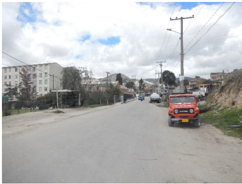
Vista general Calle 7.