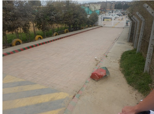
M1: Zona dura concreto