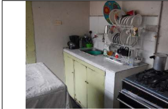
Cocina – piso 2